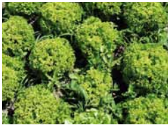
Palaterra®-Vergleich mit und ohne Palaterra

Die weltweit erste Produktionsanlage wurde in Rheinland-Pfalz im Herbst 2010 in Betrieb genommen. Mittlerweile produziert Palaterra an mehreren Standorten in Deutschland. Es wird darauf geachtet, dass regionale Rohstoffe Verwendung finden, die einem umfassenden Qualitätsmanagement unterliegen.