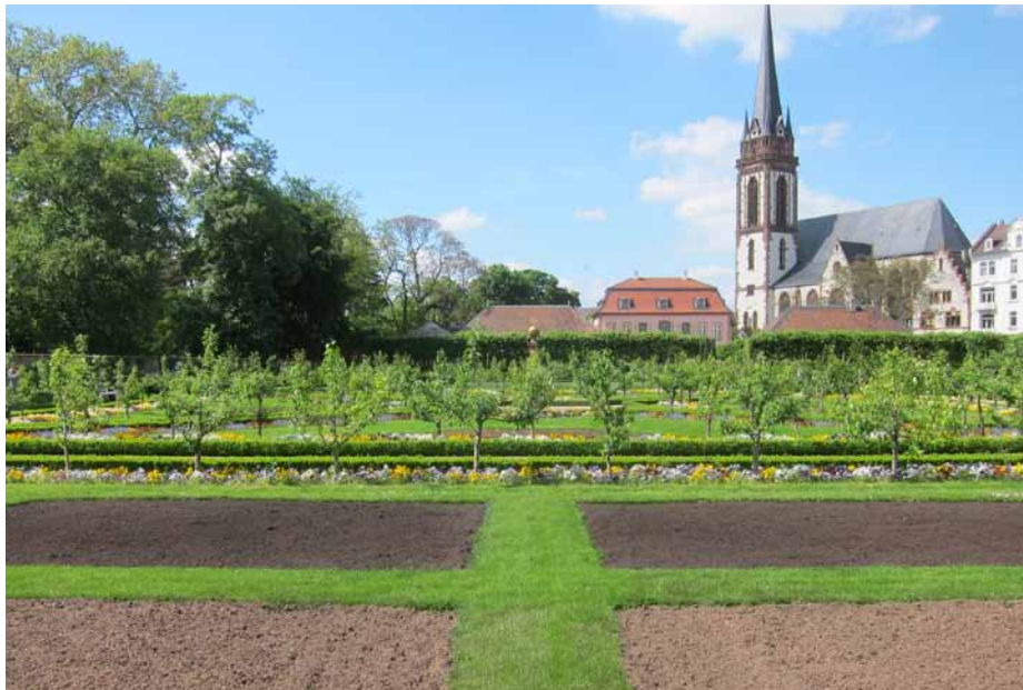
Palaterra®-Anwendung Staatliche Schlösser und Gärten Hessen, Prinz-Georg-Garten in Darmstadt

Bei der Auswahl von Standorten achten wir auf die Verfügbarkeit von geeigneten Inputstoffen wie z.B. Erntereste, Grünschnitt, Gülle, Festmist, Gärreste, Kompost. Mittels der Palaterra®-Technologie werden diese Stoffe dann zu hochwertigen Humussubstraten verarbeitet, die mit den Eigenschaften der nativen Terra Preta weitgehend identisch sind und diese teilweise sogar übertreffen.