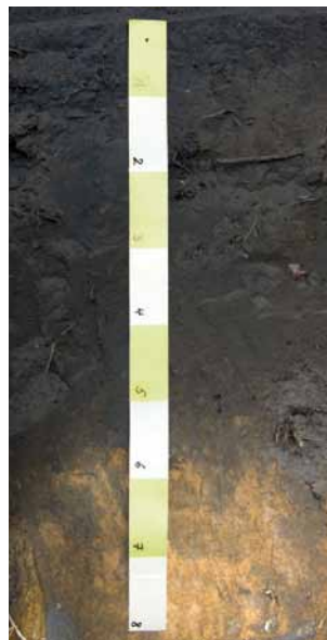
Terra Preta Boden im Amazonasgebiet