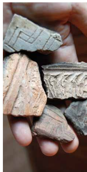
Tonscherben in der Terra Preta