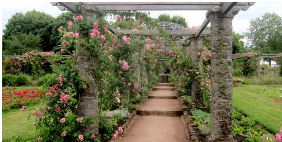
Palaterra®-Anwendung Historische Rosenhöhe in Darmstadt